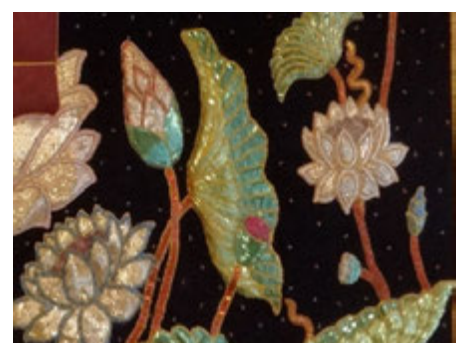
17世紀から続く立体刺繍