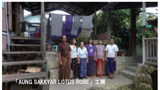
「AUNG SAKKYAR LOTUS ROBE」工房