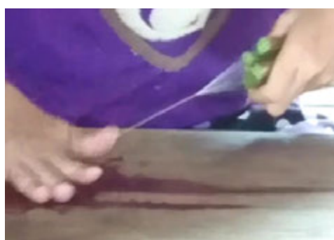
蓮の茎から藕絲を採る

☎ 03(3376)2511 fax 03(3376)5280 Email tlc@tairikyoyu.co.jp